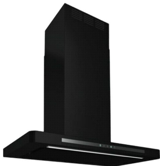
T-LINE 90 BL