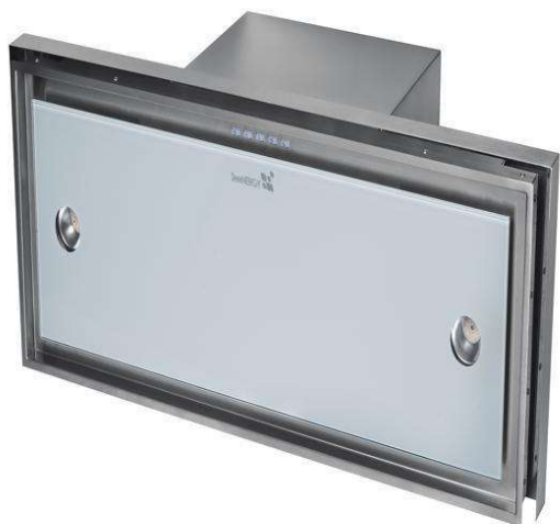
IRIS INCASSO VETRO